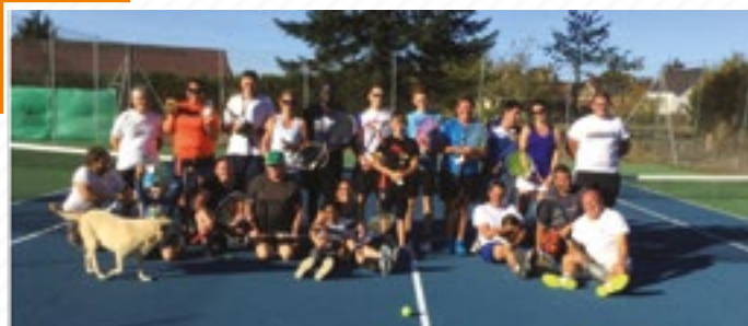
Double-surprise 15 septembre 2018 Saint-Viâtre