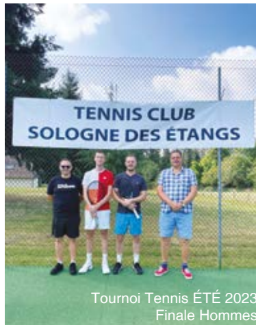
Tournoi Tennis ÉTÉ 2023 Finale Hommes

Ceci apporte un confort pour chacun de réserver à distance il suffit d'utiliser les mêmes